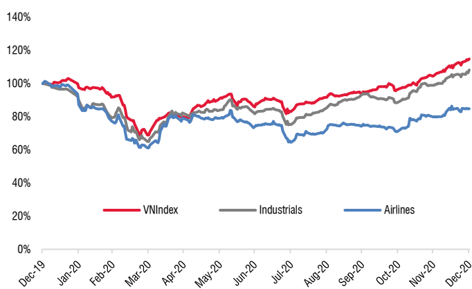
Diễn biến ngành trong năm 2020

Trong đó, giá cổ phiếu HVN và VJC đều giảm 15% so với đầu năm, nhưng cao hơn nhiều so với bình quân các công ty cùng ngành trong khu vực khoảng 30-40% so với đầu năm, do Việt Nam kiểm soát dịch Covid-19 tốt và đảm bảo thị trường trong nước hoạt động tốt, mặc dù lượng khách giảm mạnh trong một vài tháng do chính sách giãn cách xã hội.